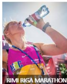
RIMI RIGA MARATHON