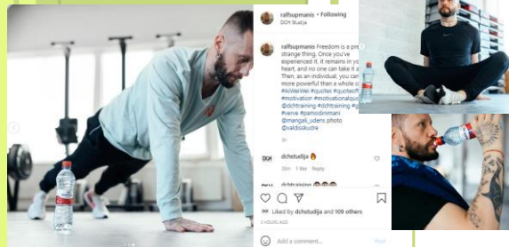
INFLUENCER / FITNESS COACH