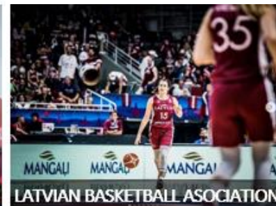
LATVIAN BASKETBALL ASSOCIATION