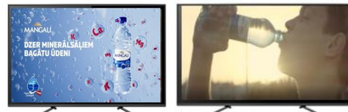
DIGITĀLIE MEDIJI, SOCIĀLIE TĪKLI