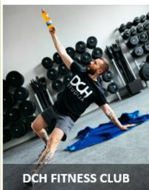
DCH FITNESS CLUB