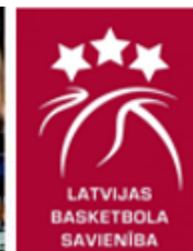
LATVIJAS BASKETBOLA SAVIENĪBA